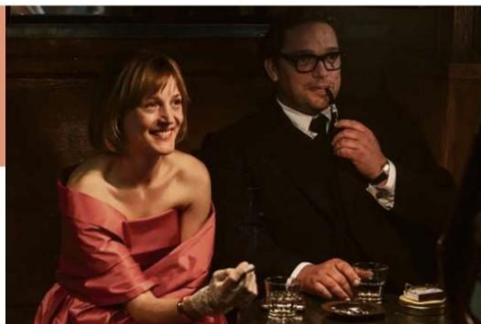
Vicky Krieps, actrice-sphinx, incarne l'autrice Ingeborg Bachmann.

Krieps incarne et atteint Bachmann non par la ressemblance du masque, donc, mais par des nuances d'ombres et de blancheur dans un jeu de météorologie diaphane. Elle la transfigure en accord avec la cinéaste, c'est une étude quasi zweiguienne, «24 Heures dans la vie de Bachmann». Les spécialistes de la poétesse comme les biographes de Max Frisch – le dramaturge charismatique et son amour avec Bachmann, que le film restitue seul –, tous les puristes s'étrangleront face à la trahison. Qu'importe, Trotta a toujours eu ce talent fin et cruel de rendre d'un couple (elle vécut vingt ans avec Volker Schlöndorff et l'œuvre traite foncièrement de cela, de cette expérience à deux-là) les tropismes, les intensités qui rapprochent deux êtres tout en éloignant l'homme de la femme : l'homme est libre de sa vanité, ego admis dans la société, la femme se voit reprocher son arrogance, nuance.