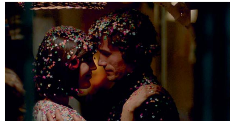
L'Honneur perdu de Katharina Blum (1975)