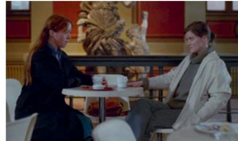
Les Années de plomb.

Cette sororité parcourt les quatre films de Von Trotta qui ressortent en salle. Dans L'Honneur perdu de Katharina Blum , seule la femme flic fait preuve d'un peu d'humanité. Des personnages masculins sont aussi des aides pour ces héroïnes (le pasteur du Second Éveil de Christa , l'avocat pour qui travaille Katharina, le compagnon de Juliane dans Les Années de plomb ). Mais leurs actions se limitent à un soutien, jamais à une émancipation. Quand le mari de Rosa Luxemburg se sent rejeté, il lui promet l'enfer. Même logique avec le compagnon de Juliane qui ne parvient pas à l'aider dans son obsession de savoir ce qui est