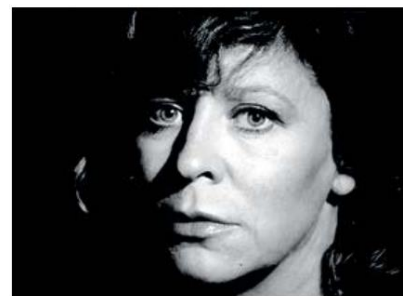
Margarethe Von Trotta.

C'est d'abord par la police que vient cette violence. Elle interroge Blum sur sa vie privée. Peu à peu, l'investigation policière tourne à l'enquête morale. Katharina ramène-t-elle souvent des hommes chez elle ? Pourquoi à ce compte des gens la surnomment-elle « la nonne » ? Et son ex-mari, pourquoi l'a-t-elle quitté, parce qu'il était