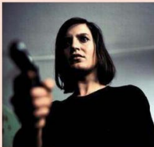
L'Honneur perdu de Katharina Blum (1976).

Alors que la sombre saga d'Action directe est au cœur d'un des romans de la rentrée ( La Vie clandestine , de Monica Sabolo) et que Marco Bellocchio vient de réaliser une série remarquable sur les Brigades rouges ( Esterno Notte , prochainement sur Arte), quelques films de MARGARETHE VON TROTTA refont opportunément leur apparition dans les salles. La cinéaste berlinoise fut l'une des toutes premières à se confronter à ces années de violence politique et à se demander ce qui avait poussé « quelques individus à une guerre sans merci contre l'État ». À l'orée des années 1980, dans LES ANNÉES DE PLOMB , électrisée par l'intense et douloureux face-à-face entre deux actrices d'exception, Jutta Lampe et